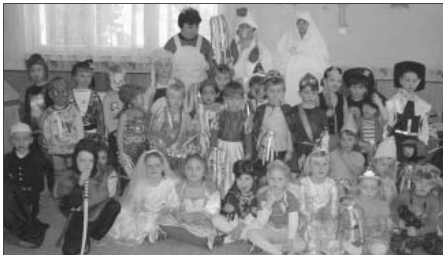
17.3. se v sále Sokolovny konal maškarní ples pro děti, který uspořádali zaměstnanci firmy Proagro, a.s., provozovna Kostomlaty nad Labem. Za perfektně zvládnutou akci jim patří veliký dík. Velké poděkování patří také všem sponzorům, bez jejichž finančního příspěví by nebylo možné tak náročnou akci provést.

Po - Pá 8.00 - 11.00 12.00 - 17.00 (úterý od 13.00) So 8.00 - 11.00