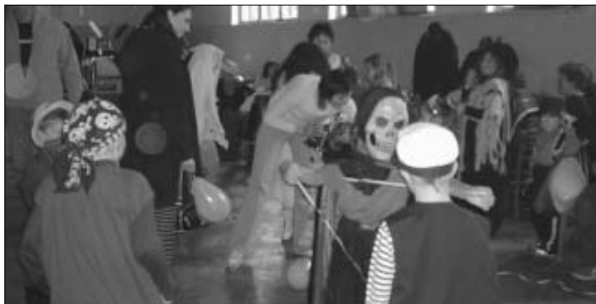
Maškarní ples si užily také děti v mateřské škole. Ve víru tance zde bylo možné vidět princezny, piráty, mušketýry čaroděje a jiné pohádkové bytosti.